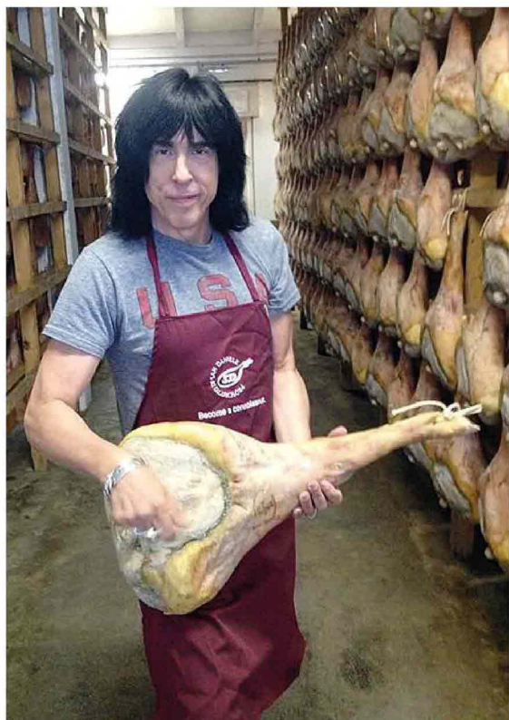
Marky Ramone trasforma un prosciutto di San Daniele in chitarra

Il tour è proseguito mercoledì mattina a Cividale del Friuli, dove ha visitato il suggestivo centro storico e il pomeriggio a Grado. Ieri, Marky Ramone si è spostato prima ad Aquileia e poi a Trieste dove ha visitato il centro storico e il Castello di Miramare. Oggi tornerà nei panni di punk rocker per tutti i fan dei Ramones, vecchi e nuovi.